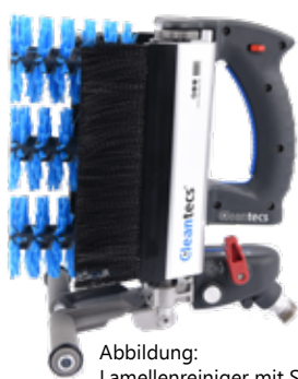
Abbildung: Lamellenreiniger mit Spritzschutz

Arbeitsdruck 120 bar/ 12 MPa Temperatur max. 60 °C Wasserleistung 10 l/min (600l/h) Dimension LxHxB 300 x 320 x 260 mm Gewicht 1,9 kg Anschluss M22 x 1,5 AG