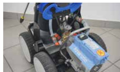
Robustes Kränzle HD-Aggregat